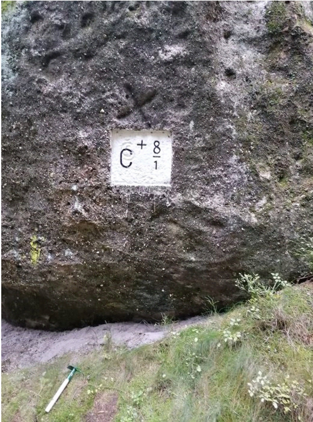
Obrázek č. 3/1

Západní strana balvanu, kde pod jeho převisem byl Olověný poklad nalezený.