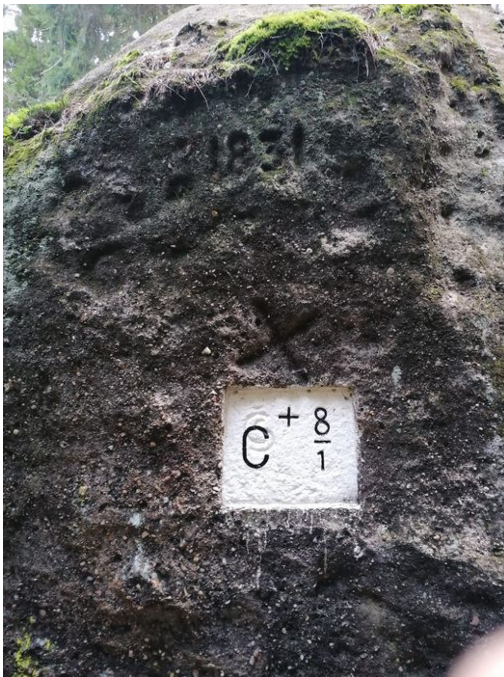
Obrázek č. 3/2

Původní tváře a pozdější značky na kamenné ploše nad místem nálezů.